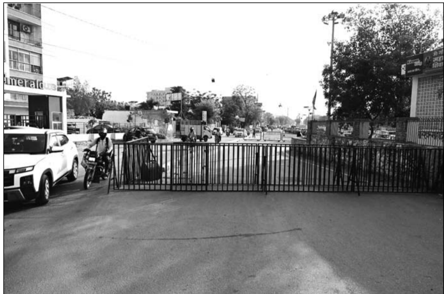
मालवीय नगर क्षेत्र में रविवार को पुलिस और आरएसी कंपनियों के जवानों ने फ्लैग मार्च निकाला। इसके साथ ही नंदपुरी क्षेत्र में बैरिकेड्स लगाकर रास्ते बंद कर दिए हैं।

इंटरनेट-मैसेज और सोशल मीडिया एप्स बंद रहेंगे, बिना अनुमति रैली-जुलूस निकालने पर भी पाबंदी