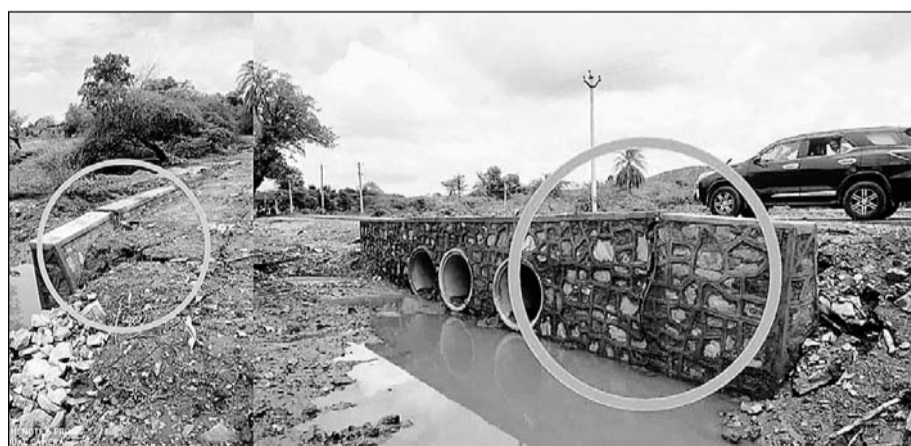
खेरवाडा-इंगूरपुर मार्ग पर बारो का शेर के निकट क्षतिग्रस्त निर्माणाधीन पुल की दीवारों।

खेरवाडा से इंगूरपुर के बीच बारो का शेर के पास बने पुल के दीवार में अभी से दरारें पड़ गई हैं। जब कि वर्तमान में सारे आवागमन के वाहन बाईपास रोड से जा रहे हैं। ऐसे में यदि बनने के साथ ही पुल क्षतिग्रस्त हो रहे हैं तो निर्माण कार्य में प्रयुक्त सामग्री घटिया प्रयोग में लाई जा रही है जब कि इस कार्य के लिए केन्द्रीय लोक निर्माण विभाग के अधिकारी समय समय पर इन कार्यों का निरीक्षण भी कर रहे हैं। ऐसे में इन पुलों का बनने से पहले ही क्षतिग्रस्त होना विभागीय अधिकारियों की कार्यप्रणाली को भी संदेह के घेरे में ला रहा है। वहीं इस कार्य को कानने वाली कार्यकारी एजेन्सी भी विभागीय नियमों