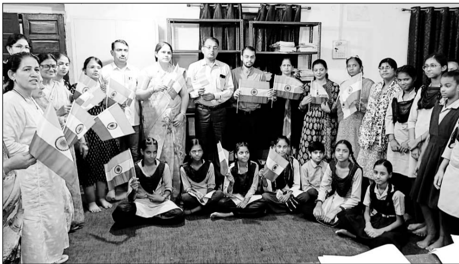
तिरंगा चित्रकारी प्रतियोगिता का अवलोकन करने जिला कलेक्टर व अधिकारी।

जिला कलेक्टर ने बताया कि मा. मुख्यमन्त्री श्री भजनलाल शर्मा की मंशा के अनुरूप स्वाधीन दिवस के उपलक्ष्य में राष्ट्र प्रेम की भावना को प्रदर्शनात्मक रूप से हृदय में सुदृढ़ करने के उद्देश्य से "हर घर तिरंगा" उत्सव अभियान स्तर पर मनाया जा रहा है। जिले में इस अभियान को सफल बनाने के लिए समस्त विद्यालयों में राष्ट्र भक्ति की भावना से ओतप्रोत विभिन्न गतिविधियाँ संचालित की जा रही हैं जिनमें तिरंगा फोटोज, तिरंगा सेलफिज, तिरंगा शपथ एवं तिरंगा चित्रकारी प्रतियोगिता आदि गतिविधियाँ सम्मिलित हैं। इस गतिविधियों में सभी