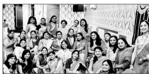
सखी एंजल संस्था द्वारा हरियाली तीज पार्टी का आयोजन किया गया।

इसी के चलते संस्था द्वारा हरियाली तीज पार्टी का आयोजन किया गया। महिलाओं को ड्रेस कोड लहरियाएँ लहंगा रखा गया। सभी को सोलह श्रृंगार करके आना था। जिससे प्रोठाम में चार चौंद लग जाये। सभी मेंबरस ड्रेस अप में बहुत सुन्दर लग रहे थे। जिससे पार्टी में रौनक आ गयी। सावन में झुला ना हो तो सुना रहता है इसलिए सभी झुले का आनंद लिया। महिलाओं के लिए सावन और राखी से सम्बंधित गेम रखे गये।