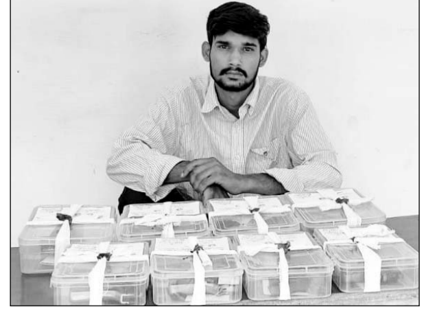
चंदवाजी थाना पुलिस ने अवैध हथियारों के साथ आरोपी को पकड़ा।