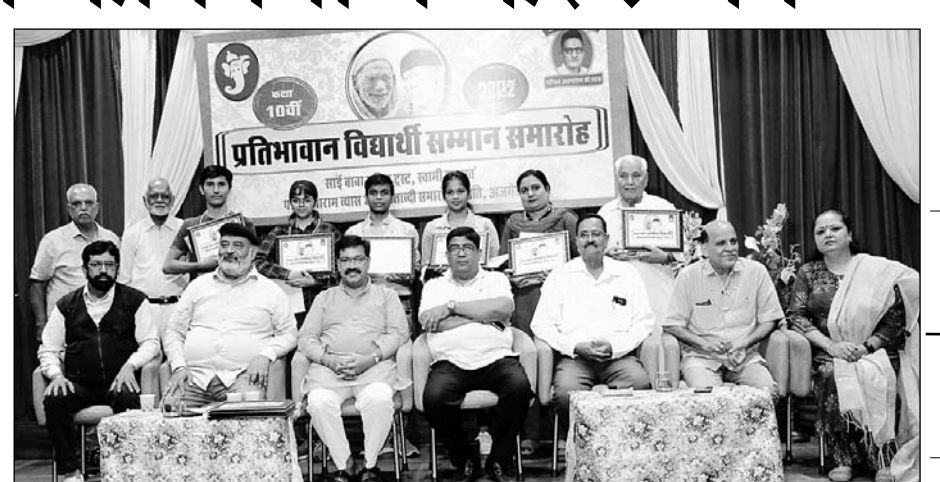
32वां प्रतिभावन सम्मान समारोह में 305 विद्यार्थी सम्मानित किये गये।

अजमेर, (कास)। साईं बाबा मंदिर ट्रस्ट स्वामी गुप एवं पंडित आत्माराम व्यास जन्म शताब्दी समारोह समिति के संयुक्त तत्वावधान में रविवार को आयोजित समारोह में राजस्थान बोर्ड एवं सीबीएसई की दसवीं कक्षा परीक्षा में 75 प्रतिशत एवं अधिक अंक प्राप्त 305 से अधिक छात्र-छात्राओं को