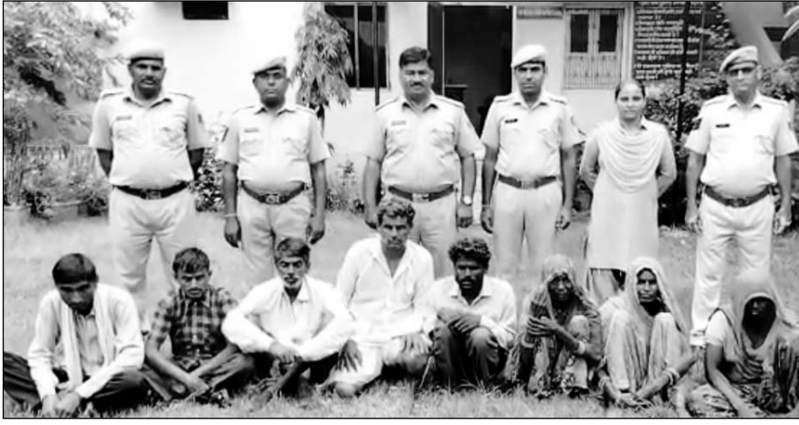
मांडलगढ़ के काछोला थाना पुलिस ने कृषि भूमि की फर्जी रजिस्ट्रियों के आरोप में आठ जनों को गिरफ्तार किया।

पुलिस के मुताबिक इस पूरे खेल में भूमिफिया गिरोह के साथ मालका