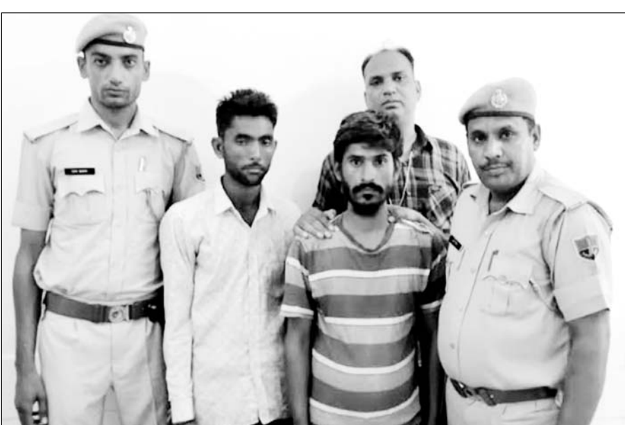
क्रिश्चियनगंज थाना पुलिस ने अपहरणकर्ताओं को गिरफ्तार किया।