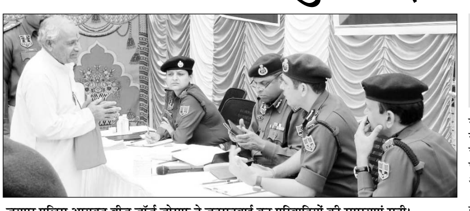
जयपुर पुलिस आयुक्त बीजू जॉर्ज जोसफ ने जनसुनवाई कर परिवारियों की समस्याएं सुनीं। निरीक्षण कर जानकारी भी ली जा रही है। आयुक्त ने बताया कि जनसुनवाई के दौरान क्षेत्र में आपसी मुकदमों, पारिवारिक व जमीनी विवाद, मकानों पर कब्जे, ट्रैवल कंपनियों के द्वारा फर्जीवाड़ा, अवैध रूप से रहे

बीजू जॉर्ज जोसफ ने कहा कि जनसुनवाई के दौरान परिवारियों की समस्याओं का मौके पर ही समाधान किया जा रहा है। उन्होंने कहा कि पुलिस की इस सकारात्मक पहल से आमजन में विश्वास और अपराधियों में डर बढ़ रहा है। उन्होंने कहा कि आमजन को राहत देने के लिए सभी थानों में भी प्रतिदिन जनसुनवाई की जा रही है। यही नहीं जनसुनवाई के बारे में औचक