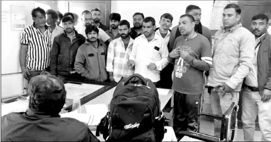
क्षेत्रवासियों ने जलदाय विभाग के अधिकारियों से समस्या समाधान की मांग की।

जलदाय विभाग पर प्रदर्शन के दौरान क्षेत्रवासियों ने बताया कि हर दिन पानी के इंजाम के लिए दूर-दूर तक