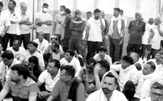
हड़ताल पर बैठे रोडवेज कर्मचारी।

करौली, (निं.सं.)। कैलादेवी मेले के चल रहे चैत्र नवरात्रि मेले के दौरान राजस्थान रोडवेज कि बस सेवा पूरी तरह से ठप हो गई है। रोडवेज कर्मचारियों ने ओवरटाइम और ड्यूटी भत्ते में कटौती के विरोध में हड़ताल शुरू कर दी जिससे पुलिस और प्रशासन के अधिकारियों ने हडकंप मच गया वही जिला प्रशासन, रोडवेज प्रबंधन जयपुर से आये अधिकारियों कि समझाईश के बाद चालक परिचालक मान गये और 6 घंटे बाद पुनः बसों का संचालन शुरू कर दिया।