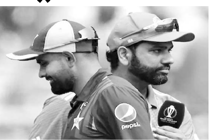
बोर्ड के अनुसार, पाकिस्तान में सुरक्षा के संबंधित दिक्कतों हैं, इसलिए टीम पाकिस्तान को कोशिश कर रहे हैं कि भारत और पाकिस्तान के बीच मैच के बिना चैम्पियंस ट्रॉफी की चमक फीकी पड़ जाएगी और सबसे अहम बात ये है कि इससे बड़े पैमाने पर वित्तीय नुकसान होगा।

पाकिस्तान दूसरी तरफ टूर्नामेंट को हाइब्रिड मॉडल के तहत आयोजित नहीं करने पर अड़ा हुआ है। आईसीसी बोर्ड की बैठक वरुअल तरीके से होगी और इसमें चैम्पियंस ट्रॉफी के कार्यक्रम को लेकर कोई हल निकलने की संभावना है। आईसीसी के फैसले से ठीक पहले भारत के विदेश मंत्रालय के प्रवक्ता रणधीर जयसवाल ने एक लाइन में बड़ा बयान दिया है। उन्होंने साफ-साफ लहजे में कहा कि, बीसीसीआई ने बयान जारी किया है।