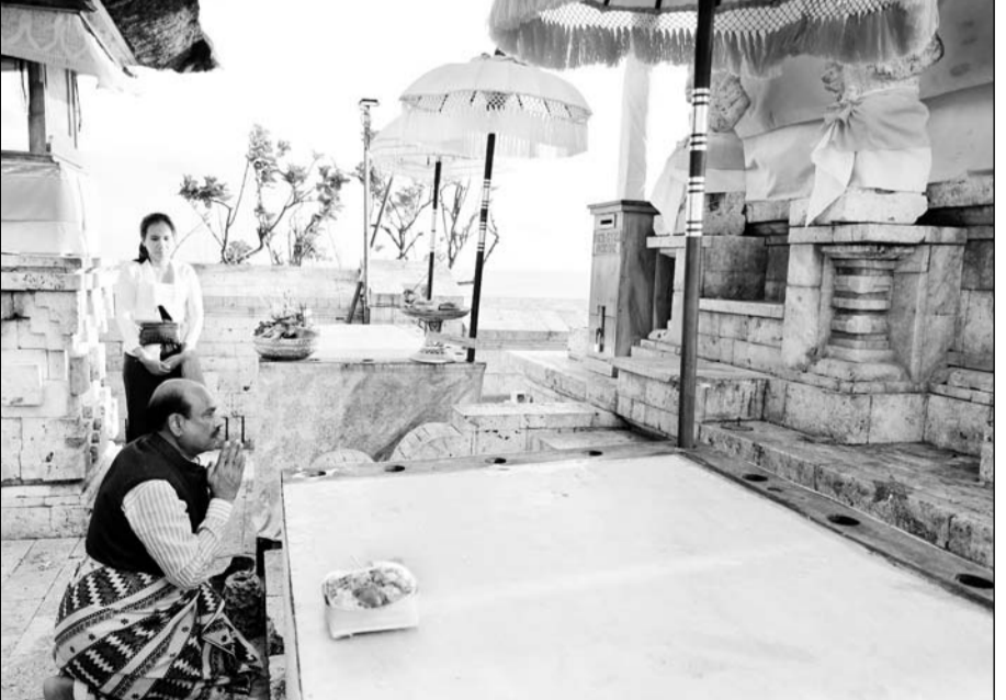
लोकसभा अध्यक्ष ओम बिरला ने बुधवार को बाली, इंडोनेशिया के उलुवातु मंदिर में पूजा अर्चना की।

जयपुर, (का.सं.)। लोक सभा अध्यक्ष ओम बिरला, जो वर्तमान में 20 शिखर सम्मेलन में भाग लेने के लिए इंडोनेशिया में हैं, ने बाली में गरुड़ विष्णु केकाना कल्चरल पार्क का दौरा किया। गरुड़ विष्णु केकाना कल्चरल पार्क में स्थित विशाल गरुड़ विष्णु केकाना प्रतिमा वास्तुशिल्प और इंजीनियरिंग का शानदार उदाहरण है। यह प्रतिमा भारतीय पौराणिक कथाओं पर आधारित है। इस अवसर पर बिरला को