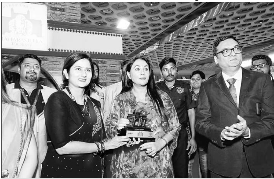
मुम्बई ओटीएम में राजस्थान टूरिज्म को सर्वश्रेष्ठ डिजाइन और सजावट का पुरस्कार मिलने पर उप मुख्यमंत्री दिया कुमारी ने खुशी जताई।

इन्फ्रास्ट्रक्चर व इको-टूरिज्म आदि के लिए प्रसिद्ध है। ओटीएम में पर्यटन विभाग की भागीदारी ने राजस्थान में विदेशी पेशेवरों के लिए पर्यटन विकास के दरवाजे खोल दिए हैं। उप मुख्यमंत्री ने मुम्बई के जियो वर्ल्ड कन्वेंशन सेंटर में आयोजित समारोह में कहा कि ओटीएम एशिया में अग्रणी ट्रेवल ट्रेड शो है। इसका आयोजन इस बार 8 से 10 फरवरी तक जियो वर्ल्ड कन्वेंशन सेंटर में किया गया है। राजस्थान पर्यटन