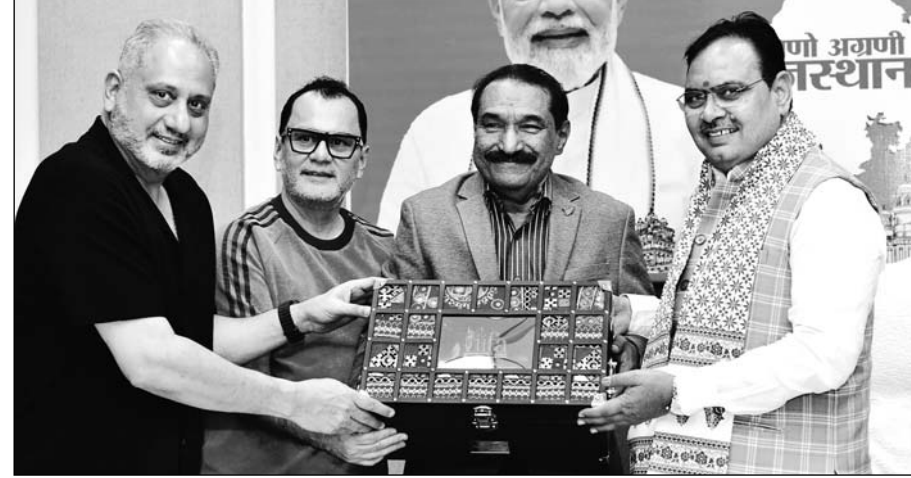
आईफा अवार्ड्स आयोजन समिति के सदस्यों ने मुख्यमंत्री भजनलाल शर्मा से मंगलवार को उनके निवास पर मुलाकात की।

जयपुर। मुख्यमंत्री भजनलाल शर्मा से मंगलवार को आईफा अवार्ड्स आयोजन समिति के सदस्यों ने मुख्यमंत्री निवास पर मुलाकात कर आईफा अवार्ड्स समारोह में शामिल होने का निमंत्रण दिया। समिति सदस्यों ने 8 एवं 9 मार्च को राजधानी जयपुर में आयोजित होने वाले समारोह सहित विभिन्न कार्यक्रमों की विस्तृत जानकारी