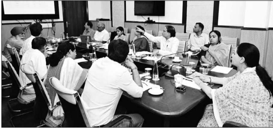
उपमुख्यमंत्री तथा महिला एवं बाल विकास मंत्री दिया कुमारी की अध्यक्षता में मंगलवार को सचिवालय में विभागीय योजनाओं एवं कार्यक्रमों की समीक्षा बैठक हुई।