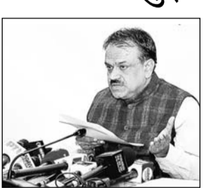
मुख्य निर्वाचन अधिकारी

जयपुर, (का.सं.)। प्रदेश के सभी जिलों में निर्वाचन विभाग द्वारा गुरुवार को राज्य के 199 विधानसभा निर्वाचन क्षेत्रों की एकीकृत फोटोयुक्त मतदाता सूचियों का अन्तिम प्रकाशन किया गया। यह सूची विभाग की वेबसाइट पर उपलब्ध है। करणपुर विधानसभा क्षेत्र की सूचियों का अन्तिम प्रकाशन 13 फरवरी को होगा। मुख्य निर्वाचन अधिकारी प्रवीण गुप्ता ने बताया कि लोकसभा आम चुनाव-2024 के लिए प्रदेश में कुल 5 करोड़ 32 लाख से अधिक मतदाता पंजीकृत हैं (करणपुर विधानसभा क्षेत्र के आंकड़ों सहित)। 199 विधानसभा निर्वाचन क्षेत्रों की प्रकाशित अन्तिम मतदाता सूचियों में कुल 5 करोड़ 29 लाख 68 हजार 476 मतदाता हैं, इनमें से 2 करोड़ 74 लाख 75 हजार 971 पुरुष, 2 करोड़ 53 लाख 51 हजार 276 महिला एवं 1 लाख 41 हजार 229 सेवानियोजित मतदाता सम्मिलित हैं। उन्होंने बताया कि 18-19 साल के 15,54,604 नव मतदाता वर्ष 2023 में संपन्न विधानसभा आम चुनाव के बाद जोड़े गए हैं, जो आगामी चुनाव में पहली बार मतदाताओं की कुल संख्या 51 लाख 56 हजार 969 है। जिनमें 26 लाख 88 हजार 498 पुरुष मतदाता एवं 24 लाख 68 471 महिला मतदाता शामिल हैं।