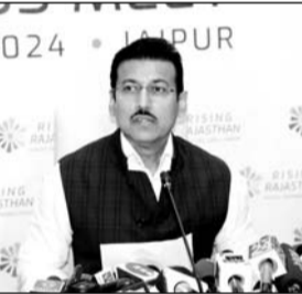
उद्योग एवं वाणिज्य मंत्री ने 'राइजिंग राजस्थान' ग्लोबल इन्वेस्टमेंट समिट 2024 से पहले मीडिया को संबोधित किया

जयपुर। मुख्यमंत्री भजन लाल शर्मा के नेतृत्व में इस वर्ष दिसंबर में जयपुर में आयोजित होने वाले 'राइजिंग राजस्थान' ग्लोबल इन्वेस्टमेंट समिट 2024 से पहले उद्योग एवं वाणिज्य मंत्री कर्नल राज्यवर्धन राठौड़ ने आज मीडिया को संबोधित किया। आज आयोजित प्रेस कॉन्फ्रेंस में माननीय मंत्री कर्नल राठौड़ ने कहा कि सरकार अगले पांच वर्षों में राज्य के सकल घरेलू उत्पाद को मौजूदा 15 लाख करोड़ रुपये से दोगुना करके 30 लाख करोड़ रुपये तक पहुंचाने का लक्ष्य लेकर चल रही है और 'राइजिंग राजस्थान' ग्लोबल इन्वेस्टमेंट समिट 2024 के जरिए प्रदेश में निवेश जुटाना सरकार की सर्वोच्च प्राथमिकता है। कर्नल राठौड़ ने यह भी कहा कि सरकार 'इज ऑफ