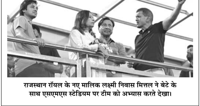
राजस्थान रॉयल के नए मालिक लक्ष्मी निवास मित्तल ने बेटे के साथ एसएमएस स्टेडियम पर टीम को अभ्यास करते देखा।