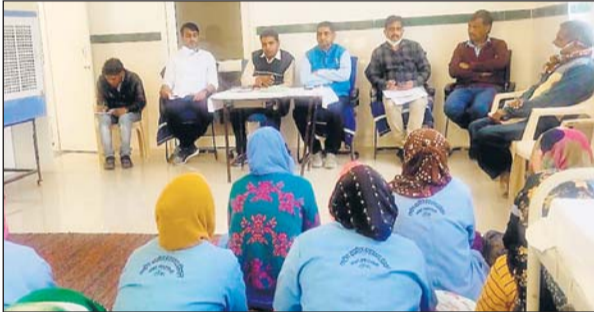
जिला स्तरीय टीम ने प्राथमिक स्वास्थ्य केन्द्र लॉम्बाकला का निरीक्षण किया।