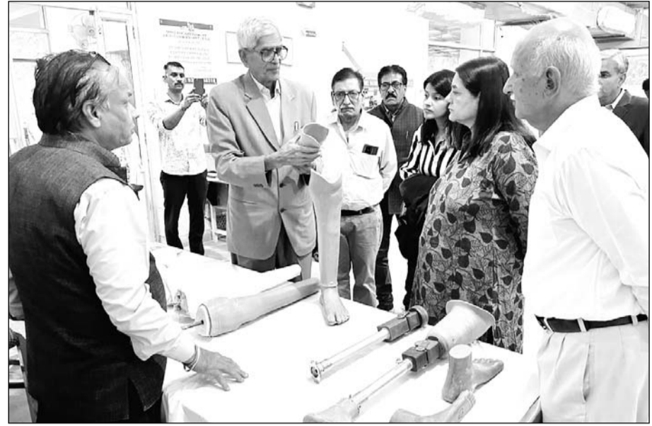
पूर्व केन्द्रीय मंत्री और भारतीय जनता पार्टी की वरिष्ठ नेता मेनका गांधी ने भगवान महावीर विकलांग सहायता समिति में विश्व प्रसिद्ध जयपुर फुट की निर्माण विधि देखी।

जयपुर। पूर्व केन्द्रीय मंत्री और भारतीय जनता पार्टी की वरिष्ठ नेता मेनका गांधी ने भगवान महावीर विकलांग सहायता समिति (बी.एम.वी.एस.ए.) में विश्व प्रसिद्ध जयपुर फुट की निर्माण विधि देखी।