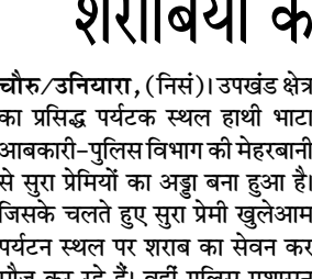
चौरु/उनिवार, (निर्स)। उपखंड क्षेत्र का प्रसिद्ध पर्यटक स्थल हाथी भाटा आबकारी-पुलिस विभाग की मेहरबानी से सुरू प्रेमियों का अड्डा बना हुआ है। जिसके चलते हुए सुरू प्रेमी खुलेआम पर्यटन स्थल पर शराब का सेवन कर मौज कर रहे हैं। वहीं पुलिस प्रशासन एवं आबकारी विभाग की कर्णित अनदेखी एवं उदासीनता के कारण यहा पर सुरू प्रेमियों की मौज हो गई है तथा हाथी भाटा की प्रतिमा के पास ही शराबियों द्वारा खुलेआम शराब की पार्टियों की जा रही है। जिसके कारण पर्यटकों के सामने गंभीर समस्याओं का अंबार लगा हुआ है।

आश्चर्यजनक बात तो यह है कि हाथी भाटा स्थल के मुख्य गेट से महज लगभग एक सौ फिट की दूरी पर ही आबकारी विभाग की कर्णित मेहरबानी से शराब की दुकान संचालित है। सुरू प्रेमी शराब की दुकान से शराब लेते हैं और मजे से पर्यटक स्थल पर बैठकर शराब की पार्टियों खुल्लेआम करते हैं। जिन्हें रोकने टोकने वाला कोई नहीं है। पुलिस प्रशासन भी इनके खिलाफ