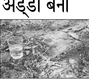
स्थल के मुख्य गेट से महज सौ फीट की दूरी पर ही शराब की दुकान संचालित।

आश्चर्यजनक बात तो यह है कि हाथी भाटा स्थल के मुख्य गेट से महज लगभग एक सौ फिट की दूरी पर ही आबकारी विभाग की कर्णित मेहरबानी से शराब की दुकान संचालित है। सुरू प्रेमी शराब की दुकान से शराब लेते हैं और मजे से पर्यटक स्थल पर बैठकर शराब की पार्टियों खुल्लेआम करते हैं। जिन्हें रोकने टोकने वाला कोई नहीं है। पुलिस प्रशासन भी इनके खिलाफ