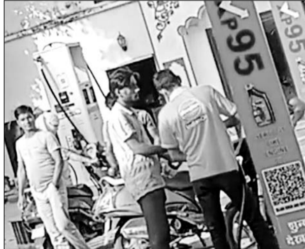
बहरोड़ के पेट्रोल पंप पर बोटल में पेट्रोल डालकर बेचते कर्मचारी।

है। जबकि लगभग हर पांच 7 किलोमीटर पर एक पेट्रोल पंप उपलब्ध है लेकिन इन पेट्रोल पंपों पर भी राजनीतिक पहुंच और प्रशासनिक संरक्षण कार्यवाही करना है या नहीं करना यह तय करवाता है। जिसके