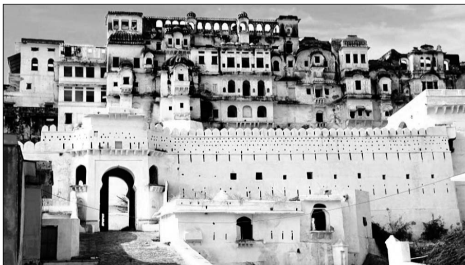
भीलवाड़ा से 70 किलोमीटर दूर भीलवाड़ा-आसिंद रोड पर स्थित यह किला अपनी बदहाली पर आंसू बहा रहा है।

बदनोर किला के भीतर की सभी इमारतें पारंपरिक राजपूताना शैली की वास्तुकला में बनी हैं जो वास्तुकला की व्यापक हिंदू शैली का एक स्थानीय रूपतर है। राजस्थान राज्य के भीलवाड़ा जिले का एक छोटा कस्बा और एक पंचायत है। यह कई गांवों के लिए एक तहसील है। बदनोर किले को भीलवाड़ा किले के नाम से भी जाना जाता है। किला मध्यकालीन भारतीय