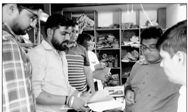
दुकान पर पॉलिथिन बरामदगी की कार्रवाई करते अधिकारी