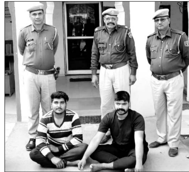
दलित युवक से मारपीट मामले में फरार वांछितों को गिरफ्तार किया।