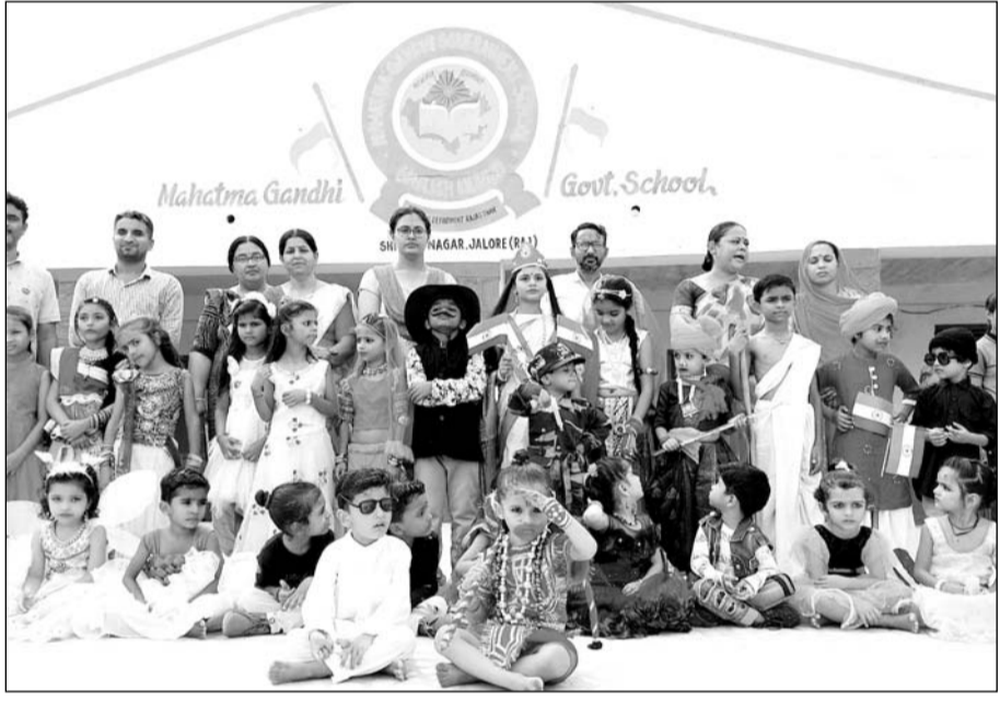
जालौर के राजकीय महात्मा गांधी अंग्रेजी माध्यम विद्यालय में फैंसी ड्रेस प्रतियोगिता का आयोजन किया।

जालौर, (कास)। आजादी का अमृत महोत्सव कार्यक्रम के अन्तर्गत महात्मा गांधी राजकीय विद्यालय (अंग्रेजी माध्यम) शिववाजी नगर जालौर में शनिवार को प्री प्राइमरी एवं प्राइमरी के विद्यार्थियों के लिए फैंसी ड्रेस प्रतियोगिता का आयोजन किया गया। जिसमें नन्हें मुन्ना प्रतिभागियों ने उत्साह पूर्वक भाग लिया।