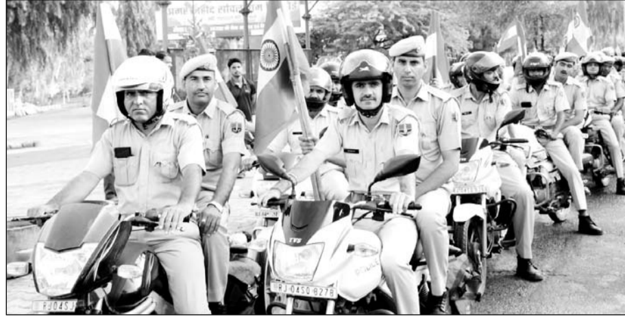
बाड़मेर में हर घर तिरंगा अभियान के तहत मोटरसाइकिल रैली निकाली गई।