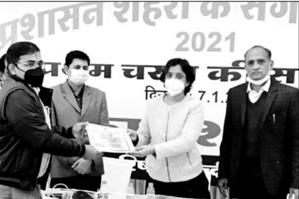
नैनवा में कार्यशाला के दौरान डीएलबी निदेशक द्वारा अधिशासी अधिकारी नगर पालिका अध्यक्ष को सम्मानित किया।