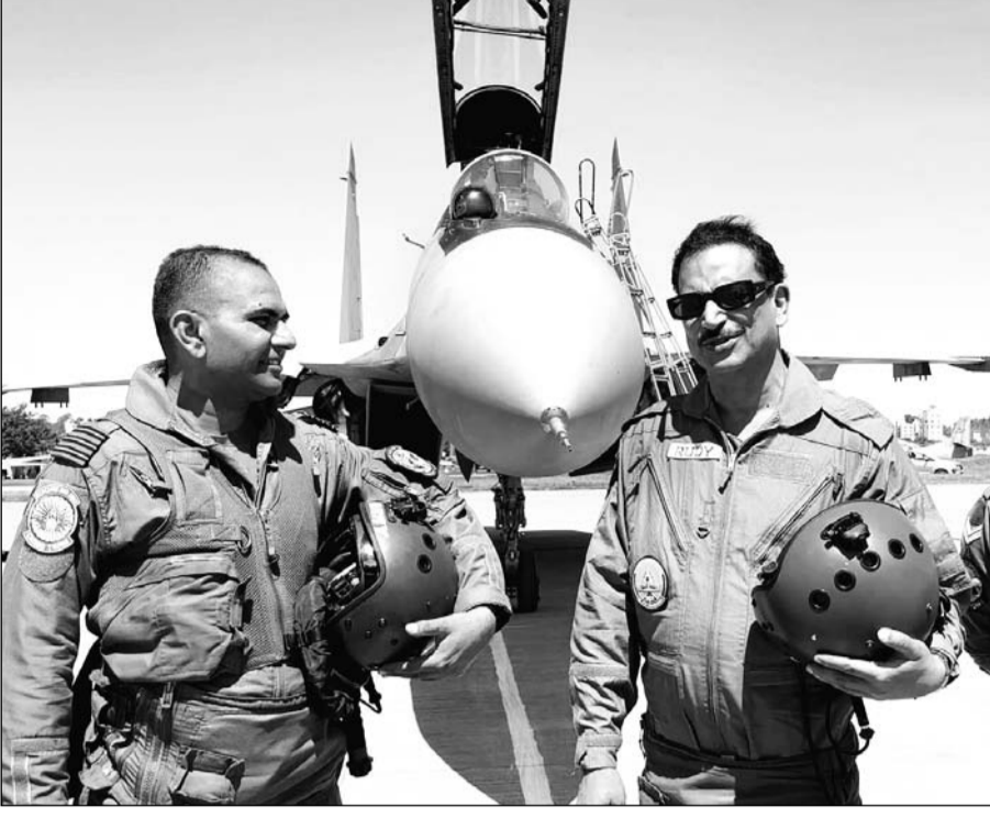
पूर्व नागरिक उड्डयन मंत्री और सारण सांसद राजीव प्रताप रूडी ने भारतीय वायुसेना के अत्याधुनिक लड़ाकू विमान सुखोई-30 एमकेआई में उड़ान भरते हुए अपनी उड़ान क्षमता और साहस का प्रदर्शन किया।