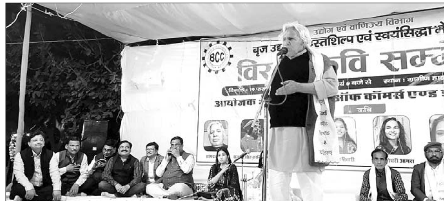
भरतपुर के हाट कम्पनी बाग में चल रहे ब्रज उद्योग-हस्तशिल्प मेले में कवियों ने अपनी कविताएं प्रस्तुत की।