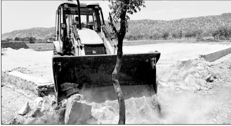
जे.डी.ए. के प्रवर्तन दस्ते ने कृषि भूमि पर काटी जा रही अवैध कॉलोनिनों को जे.सी.बी. की मदद से ध्वस्त किया।

उन्होंने बताया कि जे.डी.ए.-11 में सांगानेर स्थित ग्राम पंचायत में 4-4 बीघा कृषि भूमि पर दो अवैध कॉलोनिनों काटकर उनमें मिट्टी-ग्रेवल सड़क, भूखंडों का डिमांडेशन कर भुडिया बना ली गई थी। इसके अलावा सांगानेर स्थित ग्राम किशोरपुरा में 6 बीघा कृषि भूमि पर "शिव विहार" के