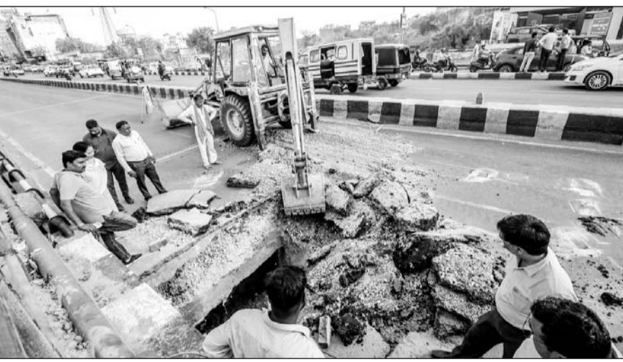
गोपालपुरा बाईपास पर गुर्जर की थड़ी अंडर पास के नजदीक धंसी मुख्य सड़क को जेडीए की टीम ने ठीक करने का काम शुरू किया।