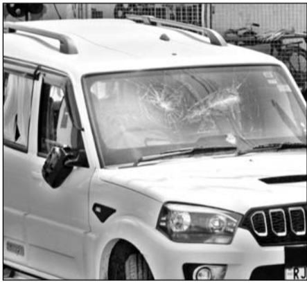
पुलिस और प्रदर्शनकारियों के बीच हुई लाठी-भाटा जंग में कई वाहन क्षतिग्रस्त हुए।

ज्ञात रहे कि दरअसल सैनी-माली और कुशवाह समाज और राष्ट्रीय फूले क्रिगेड के हजारों कार्यकर्ता गुरुवार रात 11 सूत्री मार्गों को लेकर जयपुर में सड़क पर उतर आए। सैकड़ों लोगों ने 14 नंबर चौराहे पर जाम लगा दिया।