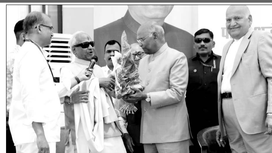
पूर्व राष्ट्रपति रामनाथ कोविन्द का तारा संस्थान के समारोह में स्वागत किया।