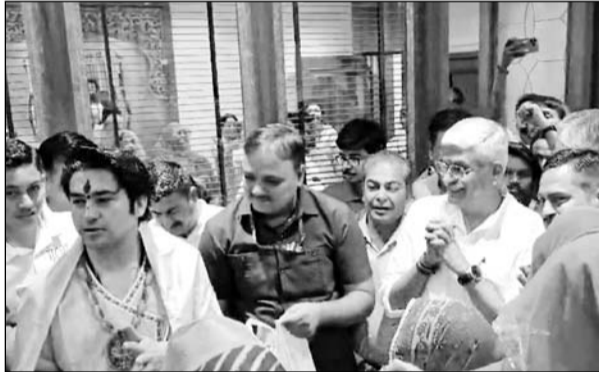
बागेश्वर धाम पीठाधीश्वर पंडित धीरेन्द्र कृष्ण शास्त्री का जोधपुर पहुंचने पर स्वागत किया।

बागेश्वर धाम पीठाधीश्वर के मंच पर आने से पहले ही मंच पर हंगामा हो गया। बागेश्वर धाम पीठाधीश्वर के पीए ने मंच पर बैठे लोगों को नीचे उतार दिया। कहा राजनीतिक लोग मंच पर नहीं बैठेंगे। इस दौरान मंच पर लगी