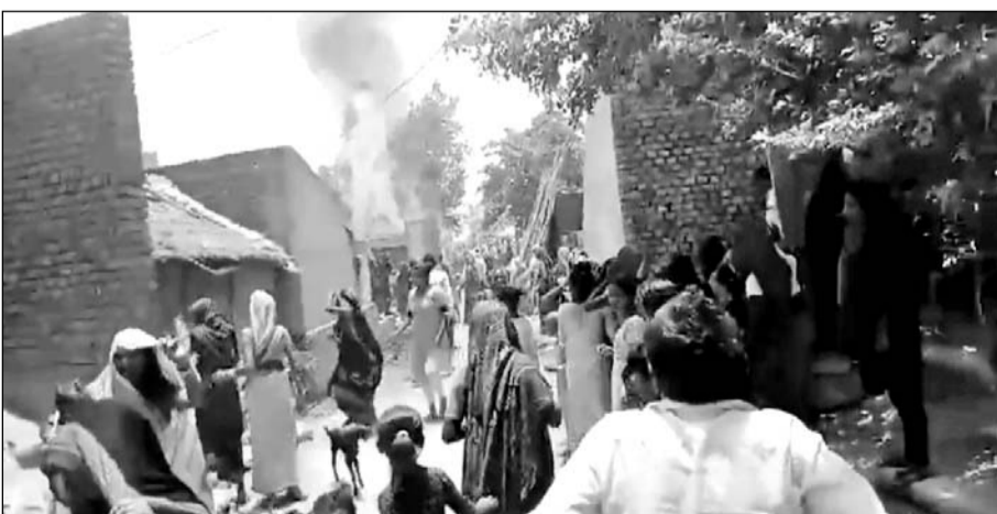
आग की लपटों को देख ग्रामीण इकट्ठा हो गए।