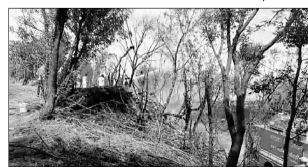
आग लगने से काफी संख्या में पेड़ पौधे जलकर राख हो गए।

खेतड़ी, (निस)। खेतड़ी उपखंड के नानुवाली बावड़ी के पास आम रास्ते में शुक्रवार दोपहर को आग लग गई। इस दौरान हवा तेज होने से आग तेजी से फैलने लगी। खेतड़ी से आई दमकल की मदद से करीब डेढ़ घंटे बाद आग पर काबू पाया गया।