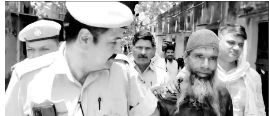
पुलिस ने कड़ी सुरक्षा के बीच आरोपी को कोर्ट से निकाल कर जेल भिजवाया।

आरोपी को कोर्ट में पेश करने पर भीड़ की मांग पर आरोपी ने माफी मांगी