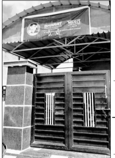
कार्यालय जहां वारदात घटित हुई।

कम्पनी में नहीं थे कहीं भी सीसीटीवी:- फाइनेंस कम्पनी की बड़ी लापरवाही भी सामने आई है। कम्पनी में रोजाना पैसों का लेनदेन होता है बावजूद इसके ऑफिस में कहीं भी सीसीटीवी नहीं लगे थे। आसपास में भी कहीं सीसीटीवी कैमरे नहीं होने से पुलिस को बदमाशों के बारे में फिलहाल कोई पुछ्छा सूचना नहीं मिल पाई है। घटना की सूचना मिलने के बाद से ही पुलिस आसपास के सीसीटीवी कैमरे खंगालने में लगी रही, लेकिन फिलहाल कोई वक्त्तु इस बारे में नहीं मिल पाया है। फाइनेंस कम्पनी के दोनों कर्मचारी ये तो बता रहे हैं कि दोनों लुटेरे बाइक से आए थे लेकिन बाइक के बारे में अधिक कोई डिटेल नहीं दे पाए।