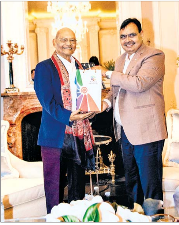
लंदन में मुख्यमंत्री भजनलाल से आज वेदांता समूह के चेयरमैन अनिल अग्रवाल ने मुलाकात की और राजस्थान में एक लाख करोड़ रु. के निवेश के लिए अपनी प्रतिबद्धता दोहराई।

मुख्यमंत्री और अनिल अग्रवाल के बीच "पूछरी का लौठा" (गोवर्धन परिक्रमा से संबंधित एक महत्वपूर्ण