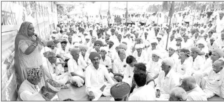
जालोर में भारतीय किसान संघ का कलैक्टेट पर महापड़ाव जारी रहा।