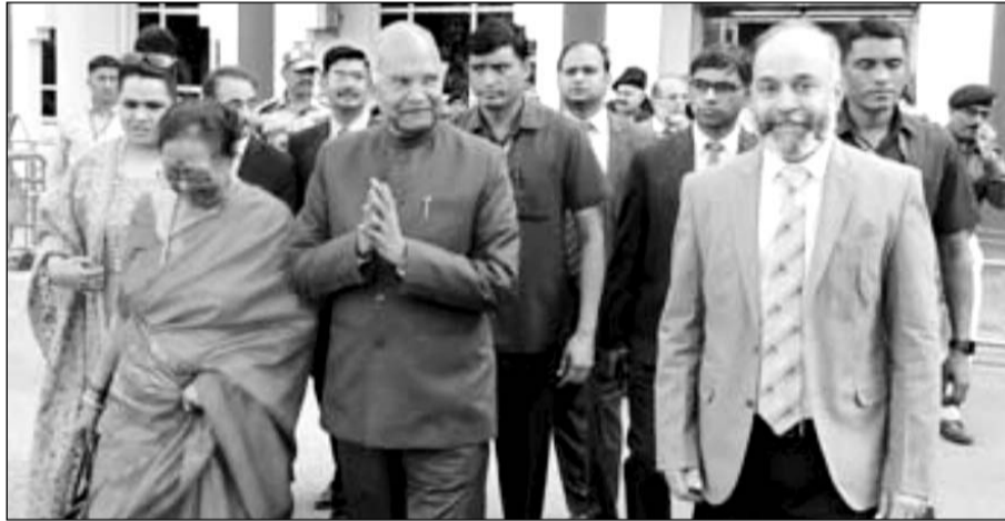
पूर्व राष्ट्रपति राम नाथ कोविंद अपनी चार दिवसीय यात्रा पर जोधपुर पहुंचे।