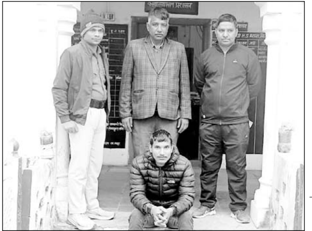
पुलिस ने हत्या के मामले में आरोपी को गिरफ्तार किया।

आरोपी ने दो साल पहले बिहार के जमुई में वारदात की थी