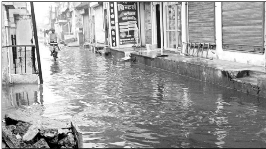
श्रीमाधोपुर में लगातार हो रही वर्षा के बाद चारों ओर पानी ही पानी हो गया।

दिनभर हो रही बरसात ने आमजन की दिनचर्या को प्रभावित कर दिया और लोग शाम तक भी घरों में गर्म कपड़ों में दुबके नजर आये। वहीं बाजार में आम दिनों की तरह चहल-पहल दिखाई नहीं दी। बाजार में रौनक नहीं दिखी। कई दुकानदार घरों में ही दुबके रहे व घरों में ही चाय, पकौड़ी, मूंगफली आदि का आनंद लेते रहे। लगातार हो रही वर्षा के बाद चारों ओर बारिश का पानी ही पानी हो गया। फिलहाल बारिश का दौर जारी है। इस बरसात से किसानों के खेतों