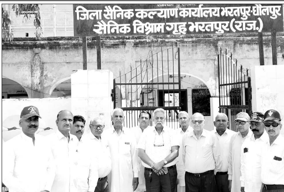
26 मार्च को भरतपुर के जिला मजिस्ट्रेट को गृहमंत्री रक्षा मंत्री भारत सरकार मुख्यमंत्री सैनिक कल्याण मंत्री राजस्थान सरकार व अन्य के नाम एक ज्ञापन सौंपेगे।