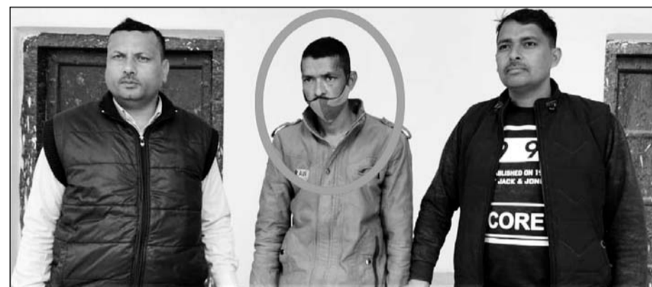
पुलिस ने ऐंटिक कछुआ के नाम पर ठगी करने वालों को दबोचा।