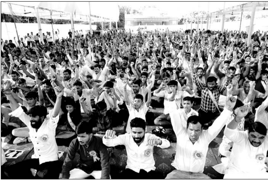
पाली में विश्व हिंदू परिषद ने त्रिशूल दीक्षा कार्यक्रम आयोजित किया।