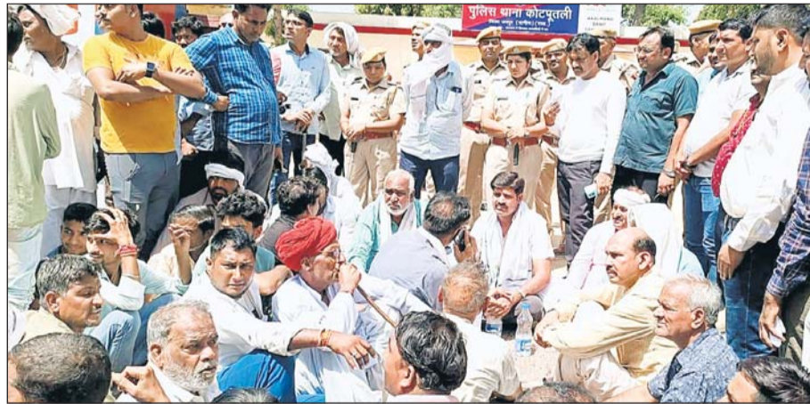
कोटपतली में ग्रामीण धरने पर बैठे।

कोटपतली, (निर्स)। कस्बे के मोहल्ला बुचाहेड़ा निवासी एक युवक के सोमवार शाम फांसी का फंदा लगाकर आत्म हत्या करने के मामले में कस्बा स्थित राजकीय बीडीएम जिला अस्पताल के मुद्दाधर के सामने परिजनों समेत जनप्रतिनिधि धरने पर बैठ गये। मामले में लगातार 27 घण्टों तक चले धरना प्रदर्शन के बाद दोनों पक्षों में सहमति बन जाने के बाद मंगलवार शाम