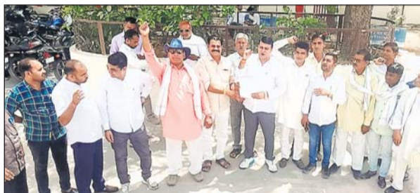
जिला सरपंच संघ ने कलेक्ट्रेट पर प्रदर्शन किया।

टोंक, (निर्स)। जिला सरपंच संघ टोंक ने केन्द्र सरकार एवं राज्य सरकार से ग्राम पंचायतों की लम्बित चली आ रही मांगों को पूरी करने की मांग को लेकर मंगलवार को प्रधानमंत्री, केन्द्रीय ग्रामीण विकास एवं पंचायती राज मंत्री, सांसद, मुख्यमंत्री राजस्थान एवं ग्रामीण विकास एवं पंचायती राज मंत्री के नाम कलेक्ट्रेट पर प्रदर्शन कर ज्ञापन सौंपा है।