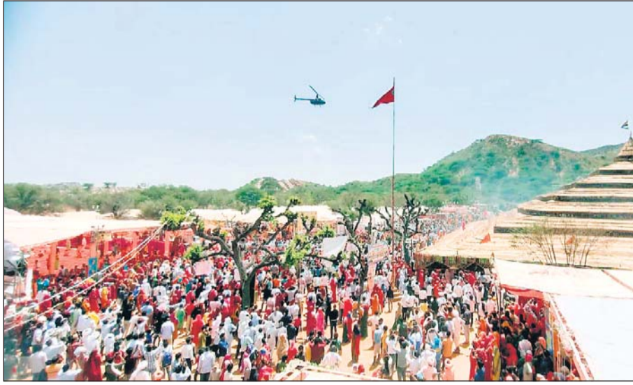
खोरी ग्राम में 108 कुंडीय सीताराम महायज्ञ के समापन पर हेलीकॉप्टर से फूल बरसाये।