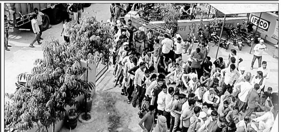
यूरिया खाद आने की सूचना पर प्राणपुरा ग्राम सेवा सहकारी समिति पर उमड़ी किसानों की भीड़।

ब्लैक करने वालों दुकानदारों के विरुद्ध कार्यवाही का भरसा दिलाया। इसके बाद जाम खुलवाया गया। इसके बाद यूरिया खाद लेने आए किसानों की पुलिस जापते के सहयोग से तहसीलदार ने लाईन लगवाकर किसानों को यूरिया खाद के कूपन वितरित किए।