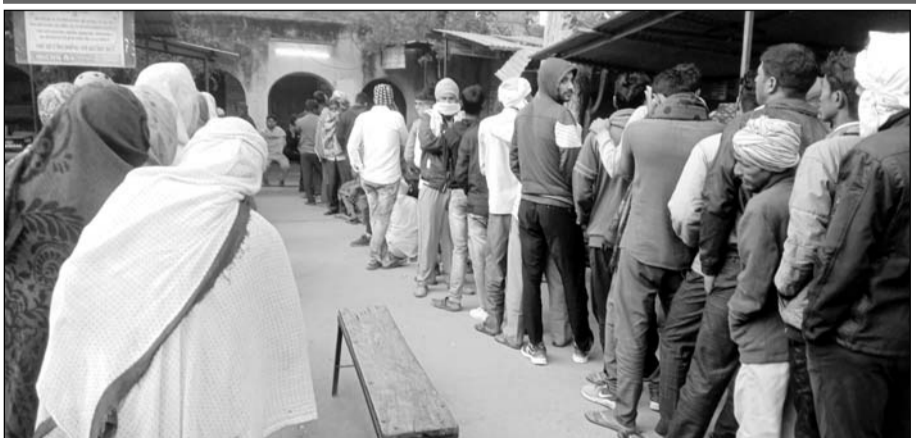
ग्राम सेवा सहकारी समिति पर यूरिया खाद के लिये लगी किसानों की लाईन।

पुलिस के पहरे में बंटा खाद, सुबह चार बजे से भूखे-प्यासे लाइन में लगे किसान