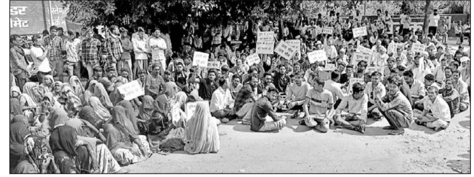
समाज के लोगों ने अपनी विभिन्न मांगों को लेकर हॉस्पिटल मोर्चरी के बाहर प्रदर्शन किया।

परिजनों ने किया प्रदर्शन, उचित मुआवजे के आश्वासन पर प्रदर्शन समाप्त