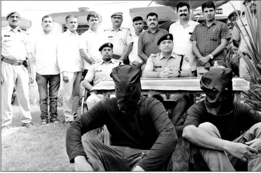
बाड़मेर में युवक की हत्या करने के दो आरोपियों को गिरफ्तार किया।