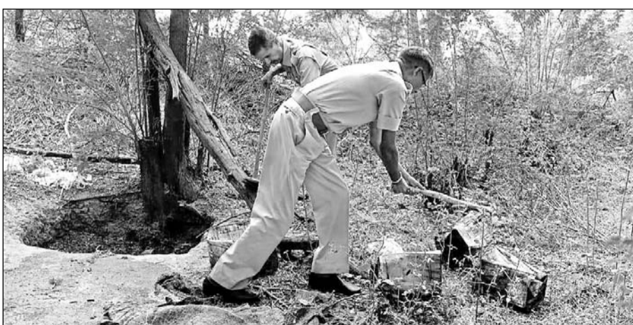
गांव सजिया की खाल्या की ढाणी में वाश व भट्टियों को नष्ट करते हुए पुलिसकर्मियों।