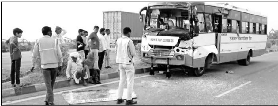
गांव मूंडिया बाईपास पर सड़क दुर्घटना में क्षतिग्रस्त हुई बस।

निवाई, (निर्स)। सोमवार की शाम पांच बजे लोक परिवहन की बस ने कंटेनर के पीछे से टक्कर मारी दी जिससे बस में सवार 6 यात्री घायल हो गए। बस सवार यात्रियों के चिल्लाने की आवाजें सुनकर आसपास के ग्रामीण दौड़कर आए और घायल यात्रियों को