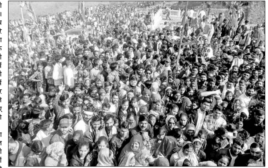
बाणगंगा में पहाड़ी पर स्थित चौथ माता के दर्शनों के लिये श्रद्धालुओं की भीड़ उमड़ी।

बूंदी (निसं)। श्रद्धा के आगे सुबह की गलन भरी सर्दी बौनी नजर आई। बाणगंगा में पहाड़ी पर स्थित चौथ माता का पांच दिवसीय मेले के दूसरे दिन संकट चूल्हों के अवसर पर माता के दर्शन और अपनी मनोकामना के लिए बून्दी सहित आसपास के सभी क्षेत्रों से श्रद्धालु माता के दरवार में मत्था टेकने पहुंचे। अलसुबह से ही चौथ माता मंदिर के रास्ते में श्रद्धालुओं का रैला लगा रहा। शहर के हर मार्ग पर पैदल जाने वाले श्रद्धालु माता के जयकारे लगाते हुए नजर आए। इस दौरान कई श्रद्धालु नंगे पैर भी दिखाई दिए।