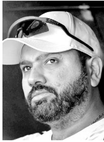
बोकेसी कॉम्प्लेक्स में दौड़ते रोहित शर्मा का वीडियो सोशल मीडिया पर काफी वायरल हो रहा है। भारत के पूर्व सलामी बल्लेबाज

इंग्लैंड के खिलाफ वनडे सीरीज और चैम्पियंस ट्रॉफी को लेकर रोहित ने अभी से तैयारी शुरू कर दी है। रोहित को फिटनेस को लेकर भी काफी सवाल उठ रहे हैं और इस वजह से भारतीय कप्तान अपनी फिटनेस पर जमकर काम कर रहे हैं। इंग्लैंड और चैम्पियंस ट्रॉफी को देखते हुए रोहित खुद को फिट रखना चाहते हैं। इस बीच मुंबई के