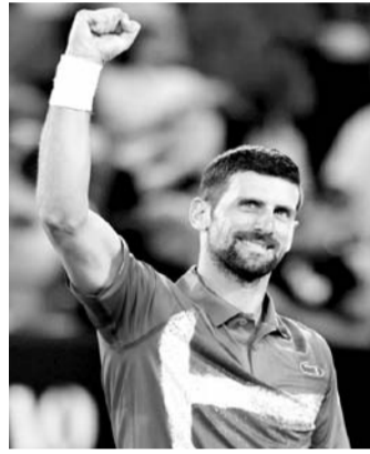
दूसरे दौर के मैच में कोर्ट पर उतरते ही ग्रैंडस्लैम प्रतियोगिताओं में सर्वाधिक मैच खेलने का रिकॉर्ड बनाया जबकि नाओमी ओसाका पिछले तीन साल में पहली बार किसी ग्रैंडस्लैम टूर्नामेंट के तीसरे दौर में पहुंची।

मेलबर्न, 15 जनवरी। ऑस्ट्रेलियन ओपन के चौथे दिन बुधवार को जापान की नीओमी ओसाका, अमेरिका की जेसिका पेगुला और रूस की मीरा एंड्रीवा ने अपने-अपने मुकाबलों में जीत दर्ज की। आज यहां खेले गये मुकाबले में नाओमी ओसाका ने चेक गणराज्य की करोलिना मुचोवा पर 1-6, 6-1, 6-3 से जीत दर्ज कर अगले दौर में जगह बनाई। ओसाका का अगले दौर में स्विट्जरलैंड की बेलिंडा बेनसिक से मुकाबला होगा।