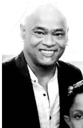
वीडियो में कांबली पहले पूर्व क्रिकेटर संजय मांजेकर से मिलते हैं फिर वह पूर्व बल्लेबाज वसीम जाफर से मुलाकात करते हैं। इसके बाद

मुंबई, 15 जनवरी। मुंबई के तमाम दिग्गज क्रिकेटरों हाल ही में मुंबई के वानखेड़े स्टेडियम की 50वीं वर्षगांठ समारोह में पहुंचे थे, जिसे मुंबई क्रिकेट एसोसिएशन की ओर से आयोजित किया गया था। इस समारोह में टीम इंडिया के पूर्व बल्लेबाज विनोद कांबली भी पहुंचे थे। तमाम बीमारियों से जूझने वाले कांबली को हाल ही में हॉस्पिटल से डिस्चार्ज किया गया था।