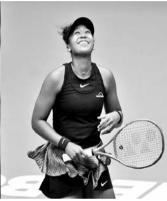
दूसरे दौर के मैच में कोर्ट पर उतरते ही ग्रैंडस्लैम प्रतियोगिताओं में सर्वाधिक मैच खेलने का रिकॉर्ड बनाया जबकि नाओमी ओसाका पिछले तीन साल में पहली बार किसी ग्रैंडस्लैम टूर्नामेंट के तीसरे दौर में पहुंची।

पहली बार किसी ग्रैंडस्लैम टूर्नामेंट के तीसरे दौर में पहुंची। उन्होंने अमेरिकी ओपन की सेमीफाइनलिस्ट करोलिना मुचोवा के खिलाफ पहला सेट गंवाने के बाद शानदार वापसी करके 1-6, 6-1, 6-3 से जीत हासिल की। ओसाका ने इस तरह से पिछले साल अमेरिकी ओपन में मुचोवा से मिली हार का बदला भी चुकता कर दिया।