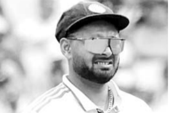
भारत के दोनों खिलाड़ियों को शेष सत्र के लिए दिल्ली के संभावित खिलाड़ियों की सूची में शामिल किया है। पंत ने अगले