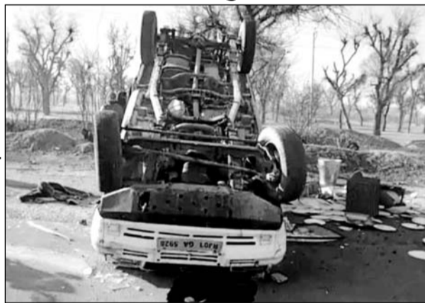
अनियंत्रित होकर पलटी पिकअप।

चौमू / कालाडोरा, (निर्स)। शनिवार को एक पिकअप गाड़ी रेनवाल थाना क्षेत्र के बथाल-इटावा रोड पर अनियंत्रित होकर पलट गई। इस हादसे में पिकअप गाड़ी में बैठे 10 लोग घायल हो गए।