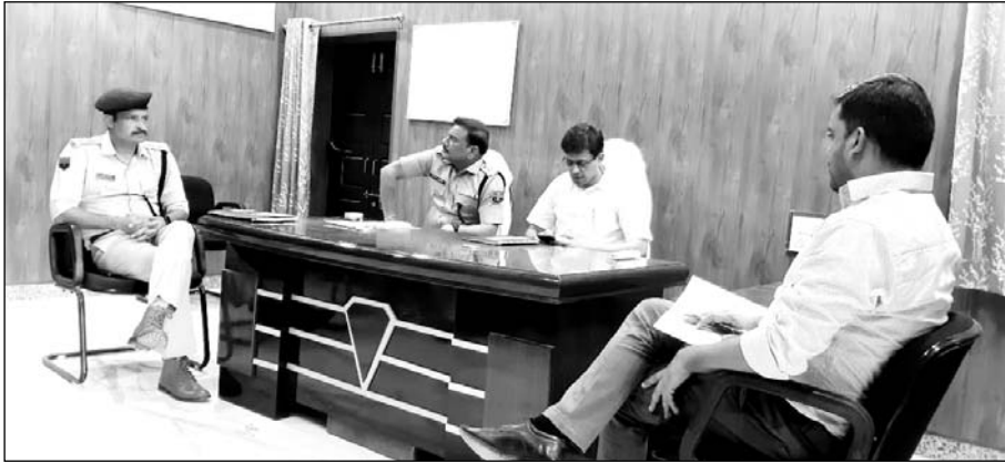
पाली जिला कलेक्टर नमित मेहता व पुलिस अधीक्षक राजन दुष्यंत ने सोजत व जेतारण क्षेत्र का दौरा कर कानून व शांति व्यवस्था की जानकारी ली।