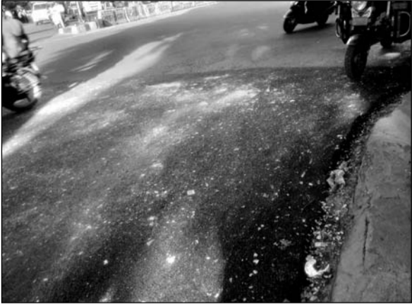
जे.डी.ए. के जोन-7 द्वारा पुलिस कमिश्नरेंट के सामने अजमेर रोड पर पूर्व में बनी अच्छी-खासी सड़क पर दो दिन पूर्व रि-कारपेटिंग की गई।