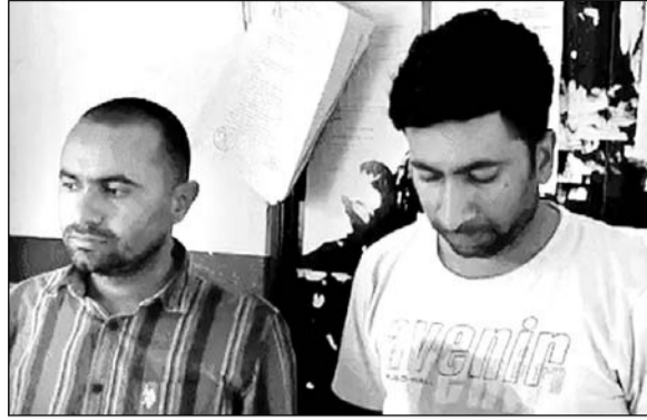
एस.ओ.जी. ने जोधपुर से एक प्राइवेट टीचर और बजरी कारोबारी को गिरफ्तार कर अजमेर स्थित कोर्ट में पेश किया।

अजमेर, (कासं)। राजस्थान लोक सेवा आयोग की ओर से आयोजित हिंदी लेक्चरर भर्ती परीक्षा 2022 में फर्जी मार्कशीट के मामले में एस.ओ.जी. ने जोधपुर से एक प्राइवेट टीचर और बजरी कारोबारी को गिरफ्तार कर सोमवार को अजमेर स्थित कोर्ट में पेश किया, जहां से कोर्ट ने आरोपियों को चार दिन की रिमांड पर सौंप दिया। एसओजी की पूछताछ में दोनों आरोपियों ने फर्जी डिग्री की मार्कशीट का सत्यापन मेवाड़ यूनिवर्सिटी से कराना काबूला है। एसओजी अब तक मामले में 9 लोगों को गिरफ्तार कर चुकी है और जांच में जुटी है।