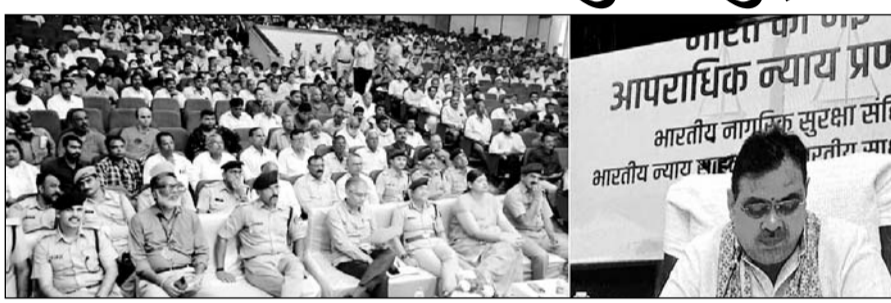
जवाहर रंगमंच में आयोजित कार्यक्रम में सीएम भजनलाल वीडियो कॉन्फ्रेंसिंग के जरिए कार्यक्रम से जुड़े।

आयोजित हुआ। कानूनों की जानकारी देने के लिए मुख्यमंत्री भजनलाल शर्मा वीडियो कॉन्फ्रेंसिंग के जरिए कार्यक्रम से जुड़े। सीएम शर्मा ने जैसे ही भाषण शुरू किया वैसे ही बिजली चली गई। प्रदेश के मुख्यमंत्री भजनलाल शर्मा की ओर से प्रदेश भर में वीडियो कॉन्फ्रेंसिंग के जरिए नए कानून की समापन कर नए कानून बनाए हैं। उन्होंने कहा कि बदलाव किए गए कानूनों की जानकारी प्रजटेशन के माध्यम से दी