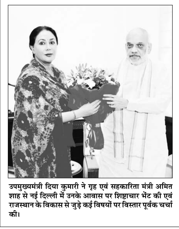
उपमुख्यमंत्री दिया कुमारी ने गृह एवं सहकारिता मंत्री अमित शाह से नई दिल्ली में उनके आवास पर शिष्टाचार भेंट की एवं राजस्थान के विकास से जुड़े कई विषयों पर विस्तार पूर्वक चर्चा की।