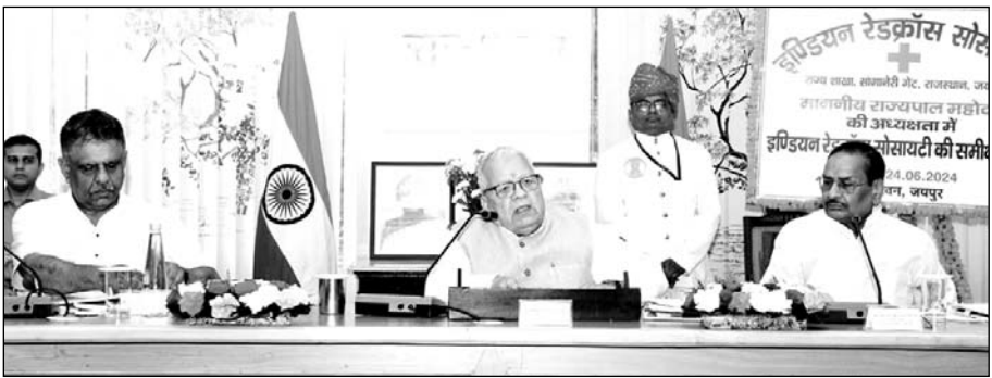
राज्यपाल कलराज मिश्र ने रेडक्रॉस सोसायटी की राज्य स्तरीय समीक्षा बैठक को संबोधित किया।

जयपुर, (कासं)। राज्यपाल कलराज मिश्र ने कहा है कि राज्य में विद्यार्थियों को निशुल्क एक दिवसीय प्राथमिक चिकित्सा प्रशिक्षण की पहल होगी। चिकित्सा और स्वास्थ्य विभाग, शिक्षा विभाग और रेडक्रॉस सोसायटी के समन्वय से प्रदेश में इसे क्रियान्वित किया जाएगा।