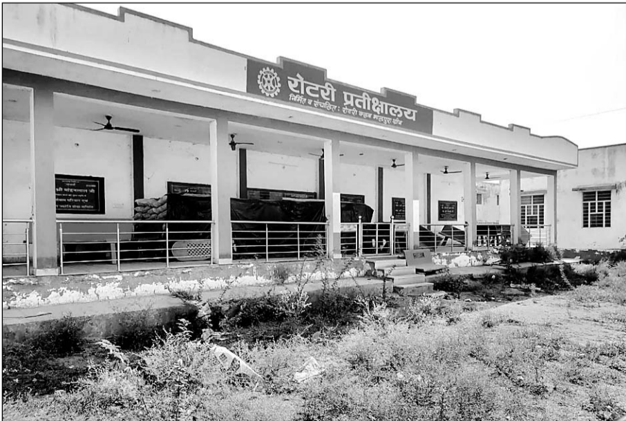
मालपुरा के सरकारी अस्पताल परिसर में रोटरी प्रतीकालय कबाड़ बना हुआ है।

मालपुरा, (निस)। राजकीय सामुदायिक स्वास्थ्य केंद्र में आने वाले रोगी व परिजनों के साथ-साथ आमजन एवं वरिष्ठ नागरिकों को सुविधा मुहैया करवाये जाने के उद्देश्य को लेकर रोटरी क्लब मालपुरा सिटी द्वारा जनसहयोग से जुटाये 25 लाख रुपये की लागत से निर्मित रोटरी प्रतीकालय आज अस्पताल प्रशासन की उदासीनता के चलते कबाड़ में तब्दील हो गया है। विधानसभा क्षेत्र के एकमात्र व सबसे बड़े मालपुरा के सरकारी अस्पताल में बढ़ती मरीजों की संख्या के साथ-साथ परिजनों व आमजन को ठण्डी छांव में बैठकर दो पल सकुन के बिताने तथा परिजनों द्वारा परिजनों को सुविधा मुहैया करवाने के उद्देश्य से रोटरी परिवार के सदस्यों ने भामाशाहों को प्रेरित कर 25 लाख रुपये की राशि जुटा अस्पताल परिसर में रोटरी प्रतीकालय का निर्माण करवाया था। निर्माण के पश्चात आमजन को बैठने के लिये दो दर्जन से अधिक सिमेंट की कुर्सियां व पंखे लगावाये गये थे, जिनकी देखरेख का जिम्मा अस्पताल प्रशासन को दिया गया था। वर्ष 2014 में प्रतीकालय का शिलान्यास व 2021 में राज्यपाल कलराज मिश्र के हाथों प्रतीकालय का क्वॉल्ट लोकार्पण कर जनसेवा के लिये समर्पित किया गया था। लोकार्पण समारोह में मौजूद हजारों नागरिकों ने रोटरी परिवार के इस पुनित