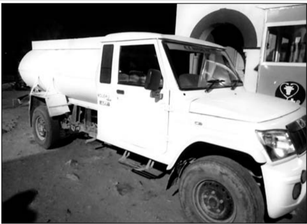
खेतड़ी पुलिस ने अवैध डीजल से भरी पिकअप गाड़ी जब्त की।